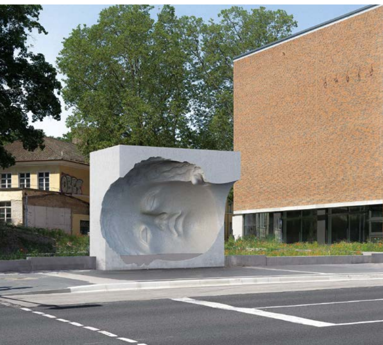
Kunstwerk von Jonathan Banz und Nikolai von Rosen in unmittelbarer Nähe des neuen Leibniz-Zentrums für Archäologie in Mainz. Die Betonskulptur stellt einen Negativabdruck des Kopfes der römischen Göttin Venus dar und dient gleichzeitig als Bushaltestelle mit Sitzgelegenheit und Unterstand. Foto: © Jonathan Banz und Nikolai von Rosen

Die Idee dafür stammt ursprünglich aus der Weimarer Republik und wurde kurz nach der Gründung des Bundeslandes Rheinland-Pfalz als Regelung eingeführt. Über die Jahrzehnte der Anwendung spiegeln die so entstandenen Kunstwerke die Entwicklung des Kunstschaffens im Land.