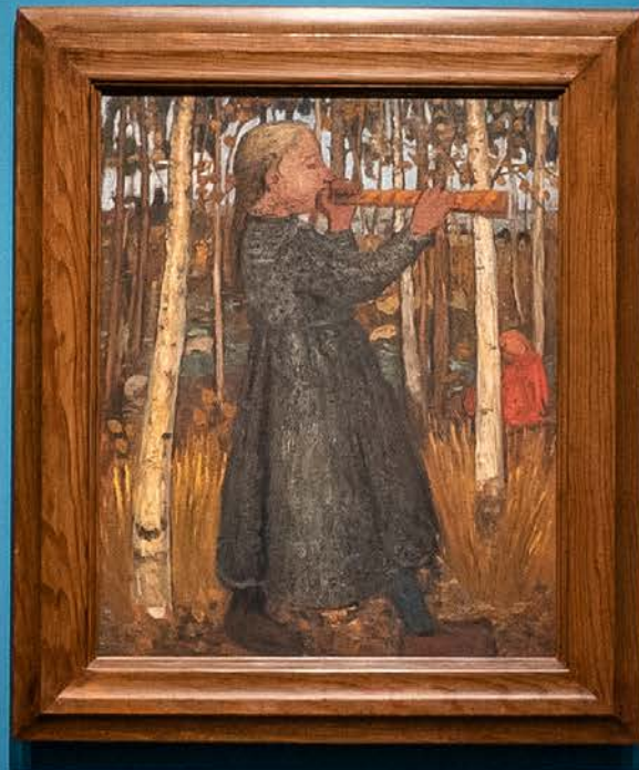
Paula Modersohn-Becker Flöte blasendes Mädchen im Birkenwald. 1905 Girl Playing the Flute in the Birch Forest. 1905. Öltempera auf Leinwand / Oil tempera on canvas Museum Böttcherstraße / Böttcherstraße Museum, Bremen Paula Modersohn-Becker Museum