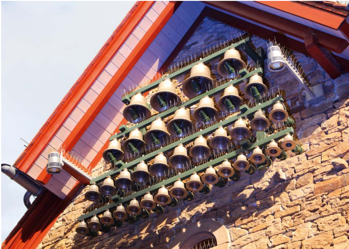
Das Carillon im „Museum für Zeit“ war Mittelpunkt des Festivals Neue Musik Rockenhausen.