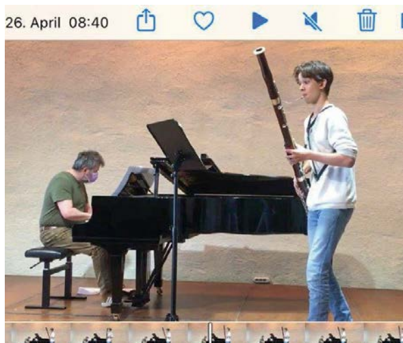
Musizieren mit Abstand und digital: Ein besonderer Landeswettbewerb „Jugend musiziert“ 2021.

Bundespreis. Mit Blick auf das Pandemiegeschehen wurden Konzepte angepasst und neu ausgearbeitet. In Rheinland-Pfalz waren 21 Jurys an vier Wertungstagen im Einsatz, um die 250 einge-