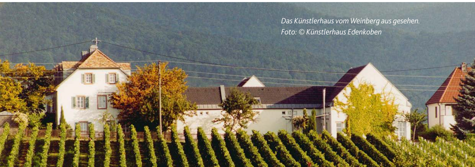
Das Künstlerhaus vom Weinberg aus gesehen.