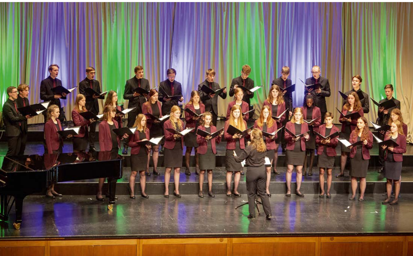
Der Jugendkammerchor der Singschule Koblenz bei seinem Wettbewerbsbeitrag zum Landeschorwettbewerb 2022.