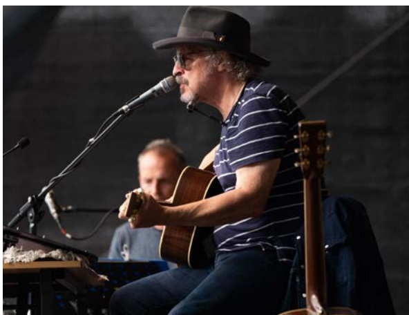
Villa Musica-Benefizkonzert für das Ahrtal mit Wolfgang Niedecken im Sommer 2021.

Beim 11. Landeschorwettbewerb, der am 8. Oktober 2022 in der Fruchthalle in Kaiserslautern stattfand, konnten sich in einem spannenden Wettbewerb rheinland-pfälzische Chöre für den Deutschen Chorwettbewerb 2023 in Hannover qualifizieren. Erstmals wurde auch ein „Offenes Singen mit Jury-Feedback“ angeboten. Damit wurde das Ziel verfolgt, um aus der Corona-Pandemie heraus gemeinsam zu einem Chortag in Kaiserslautern zusammenkommen zu können und ein konstruktives Jurygespräch zu erhalten.