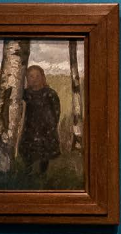
Becker Frank in Front of a Cornfield. 1904 Oil tempera on cardboard Museum für Kunst und Gewerbe Hamburg / Böttcherstraße Museum, Bremen Becker Museum