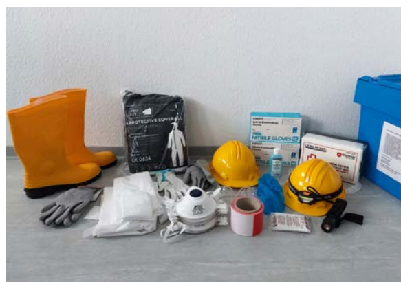
Notfallset für den Kulturgutschutz.

Bereits vor der Flutkatastrophe 2021 standen in der LBE die Themen „Prävention“ und „Notfallplanung“ auf der Agenda und wurden danach mit größtem Druck vorangetrieben. Die aus der Notfallbewältigung deutlich gewordenen Defizite bei der Notfallvorsorge wurden aufgearbeitet. Als Ergebnis wurde eine spartenübergreifende Runde