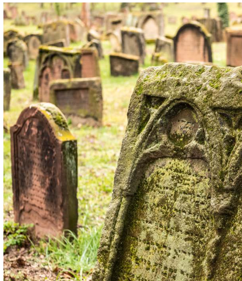
Jüdischer Friedhof „Heiliger Sand“ in Worms.

Von herausragender Bedeutung – sowohl in ihrer kulturellen als auch touristischen Ausstrahlung – sind die sieben Welterbestätten in Rheinland-Pfalz. 2021 wurden nach dem Dom zu Speyer (1981), den römischen Monumenten,