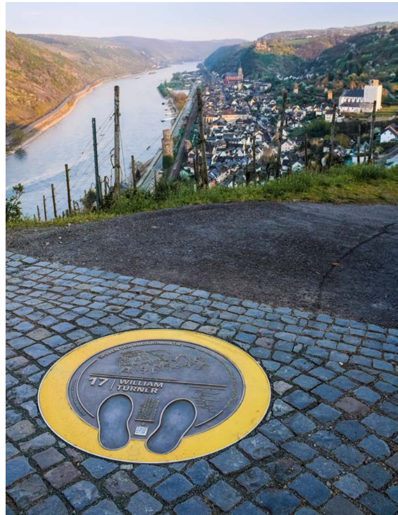
Die William Turner Route mit Blick auf Oberwesel im Mittelrheintal.

Weitere Projekte im Rahmen der Förderung von Kultur und Baukultur waren aus dem Programm „Lebendige Zentren“ die Förderung der Instandsetzung der Stadtmauerkurtine 11 und 12 und die Förderung der Instandsetzung des Haintorturms einschl. der dortigen Einrichtung einer kleinen Ausstellung zu Stadtgeschichte und Stadtmauer mit interaktivem Stadtmodell in Freinsheim.