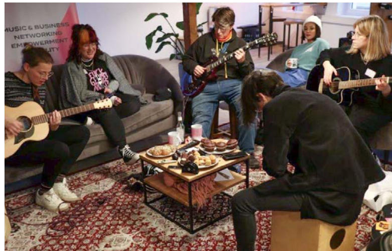
Kreativer Austausch beim MusicRLPwomen* in Koblenz.

Das Netzwerk musicRLPwomen* möchte zusammen mit pop rlp – dem Kompetenzzentrum für Populärmusik Rheinland-Pfalz, darauf aufmerksam machen, dass auf und hinter den Bühnen im Musikbusiness Frauen und andere Geschlechter deutlich gegenüber Männern unterrepräsentiert sind. Die Gründung des Netzwerks basiert auf dem Willen langfristige Veränderungen anzustoßen: Akteurinnen der Branche sollen ebenso angesprochen werden wie Menschen, die einen Einstieg suchen oder am Thema interessiert sind. musicRLPwomen* arbeitet dabei an verschiedenen Formaten, um sowohl Beiträge zum Diskurs als auch gezielte Förderung, bspw. des eigenen künstlerischen Schaffens, anzubieten.