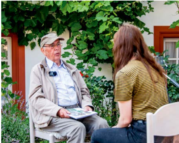
Team Bretzenheim beim Zeitzeugeninterview.

matisch zu erfassen, wissenschaftlich fundiert sowie digital aufzubereiten und im Alltag attraktiv nutzbar zu machen, für Einheimische wie Auswärtige. Das Projekt wird federführend vom Institut für Kulturwissenschaft der Universität Koblenz in Zusammenarbeit mit der Struktur- und Genehmigungsdirektion Süd (SGD Süd) in Neustadt durchgeführt. In den Jahren 2019 bis 2021 hat das Mdl die Universität Koblenz bereits mit rund 170.000 Euro gefördert. In der zweiten Förderphase von 2022 bis 2024 fördert das Mdl das Landesprojekt mit bis zu 200.000 Euro.