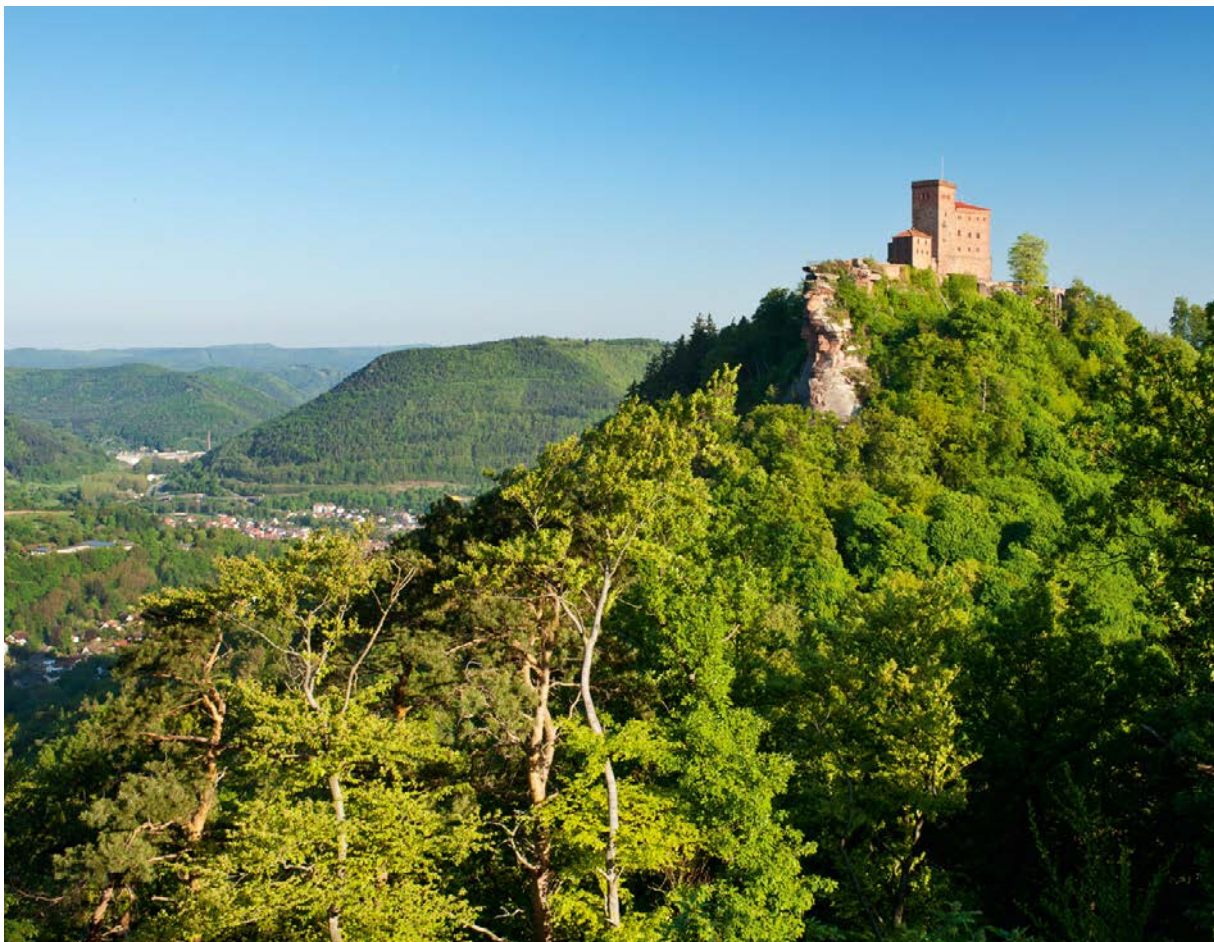
Blick auf Burg Trifels bei Annweiler in der Pfalz.

kulturellen Erbes zählt zu den Kernaufgaben der Generaldirektion Kulturelles Erbe (GDKE). Sie vereint die drei Landesmuseen in Trier, Mainz und Koblenz, die Landesdenkmalpflege und die Landesarchäologie sowie die Direktion Burgen, Schlösser, Altertüme unter einem Dach und ist eine dem Ministerium des Innern und Sport unmittelbar nachgeordnete Obere Landesbehörde.