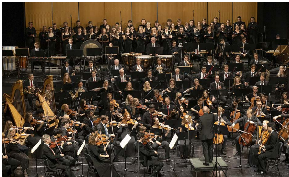
Eine Bühne voll Musik: Philharmonisches Staatsorchester Mainz mit LandesJugendOrchester und LandesJugendChor Rheinland-Pfalz im Staatstheater Mainz.

Gemeinsam mit dem Philharmonischen Staatsorchester Mainz gestalteten das LandesJugend-Orchester und der LandesJugendChor zwei große Sinfoniekonzerte im Staatstheater Mainz. Am Pult stand der langjährige Chefdirigent des Philharmonischen Staatsorchesters Mainz, Hermann Bäumer, der im Rahmen der Konzerte den „Preis des Landesmusikrats für die Verdienste um die Musik-Kultur“ in Empfang nehmen durfte. Die Konzerte am 28. und 29. Oktober 2022 stellten gleichzei-