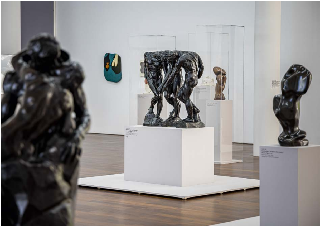
Installationsansicht der Ausstellung „RODIN/ARP“.

Die verheerende Flut im Ahrtal in der Nacht vom 14. auf den 15. Juli 2021 hat vielen Menschen ihre Lebensgrundlage fortgeschwemmt, darunter waren auch viele Künstlerinnen und Künstler. Die Präsentation #AHRt im Bahnhof Rolandseck zeigte neben Kunstwerken, die die Flut überlebt haben, Werke, die sich mit der Flutkatastrophe und dem Neuanfang auseinandersetzen. Die Schau bot ein Forum für betroffene Künstlerinnen und Künstler der Ahr-Region und war gleichzeitig eine Bestandsaufnahme.