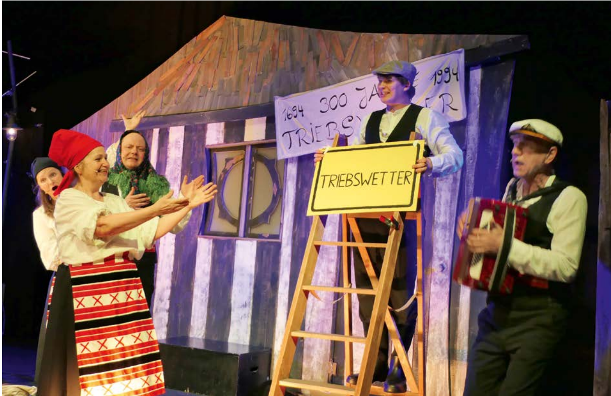
Premiere des als kommunales Kulturprojekt geförderten Stücks „Donaukinder“ des Chawwerusch-Theaters auf der Kultursommer-Eröffnung 2022 unter dem Motto „Kompass Europa: Ostwind“.