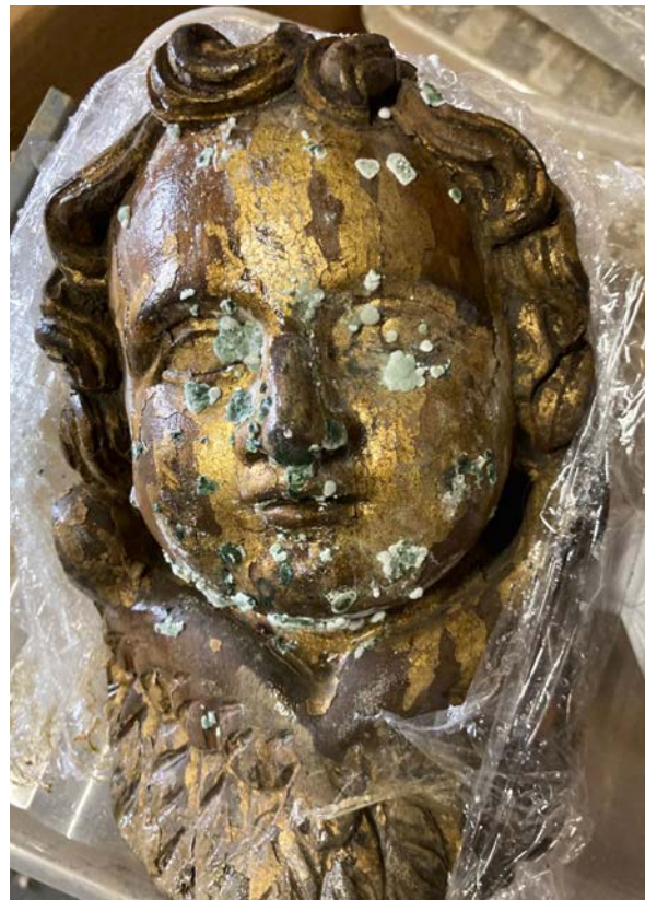
Der kleine Barockengel aus der Sammlung der Stadt Bad Neuenahr-Ahrweiler.

Die Flutkatastrophe im Juli 2021 im Landkreis Ahrweiler traf die lokalen Museen unvorbereitet. Knapp 2.800 Objekte befanden sich zur Zeit der Flutkatastrophe im Depot des Stadtmuseums in einer Tiefgarage in der Ahrweiler Altstadt. Es handelte sich dabei fast um den kompletten Sammlungsbestand seit 1906, da eine Neukonzeption der Sammlungsausstellung in Planung