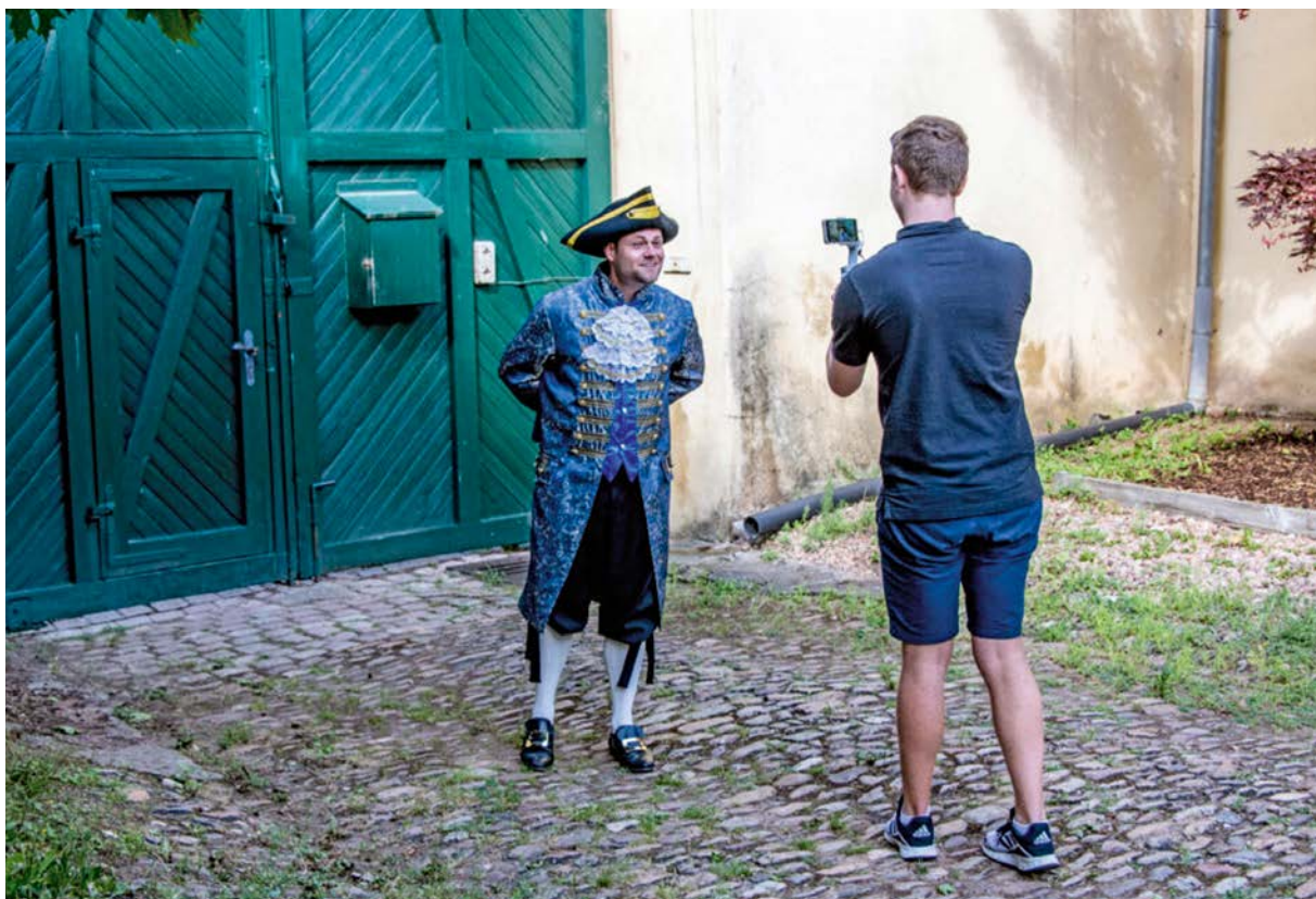
Aufnahmen in Bretzenheim (Landkreis Bad Kreuznach).

Jede Gemeinde, jede Stadt, jede Region hat ihre Besonderheiten, ihre Geschichte, ihr spezielles kulturelles Erbe, das lokale Identität stiftet. Ziel des seit 2019 vom Ministerium des Innern und für Sport (Mdi) finanzierten Forschungs-, Modell- und Förderprojekts „Digitale Erfassung und Präsentation von Kulturlandschaften in Rheinland-Pfalz“ ist es, die kulturelle Vielfalt in Rheinland-Pfalz systematisch zu erfassen und zu präsentieren.