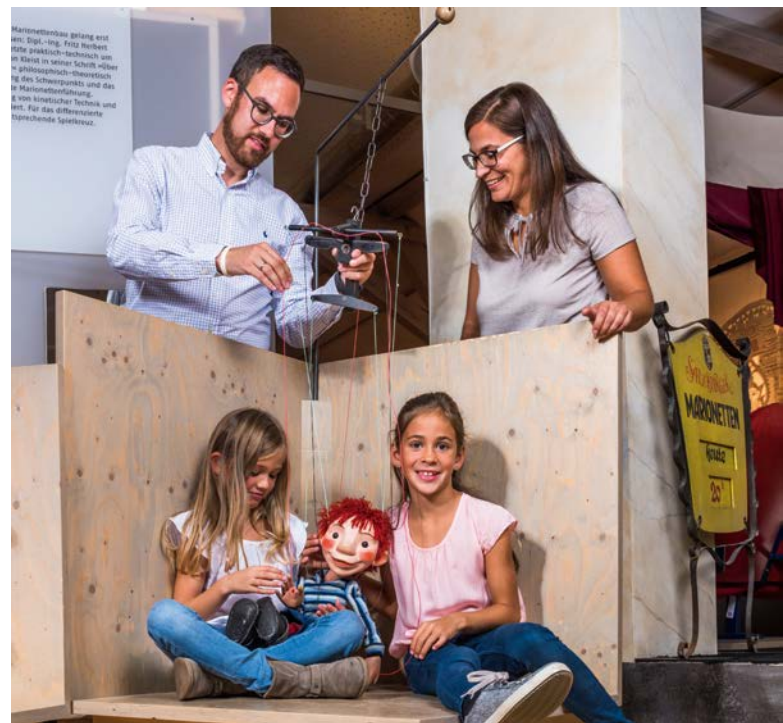
Kleine Puppentheaterfans tauchen im PuK in die Welt der Märchenfiguren und Filmhelden ein.

Sammlung gerecht – und auch die besondere Bauhaus-Architektur des Museums, das sich in einer ehemaligen Schuhfabrik befindet, kommt nun wieder voll zur Geltung.