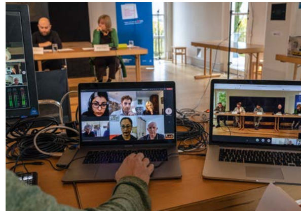
„Poesie der Nachbarn“, Hybride Lesung im Oktober 2021.

rinnen und Lyrikern zunächst nicht zustande, jedoch traf und verständigte man sich auf der digitalen Ebene, um noch nicht veröffentlichte hebräische Lyrik „nachzudichten“. Die öffentliche hybride Lesung fand im Oktober 2021 statt. Im Herbst des folgenden Jahres schließlich trafen sich die Beteiligten im Künstlerhaus Edenkoben.