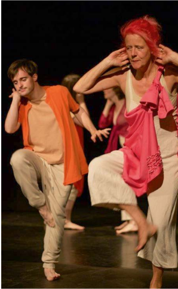
BewegGrund Trier/ DanceAbility e.V. Szene aus Tanzstück L!STEN.

Weiterhin widmen sich die geförderten Kultur-einrichtungen- und -initiativen mitunter besonderen Schwerpunkten und Zielgruppen. Ein Beispiel ist das inklusive Tanz-Ensemble BewegGrund Trier unter der Trägerschaft des DanceAbility e.V., das Menschen mit und ohne Behinderung in die verschiedenen Organisations- und Produktionsprozesse seiner Arbeit einbezieht. 2022 startete das Ensemble die mehrjährige Trilogie „L!sten – S!ee – Speak!“.