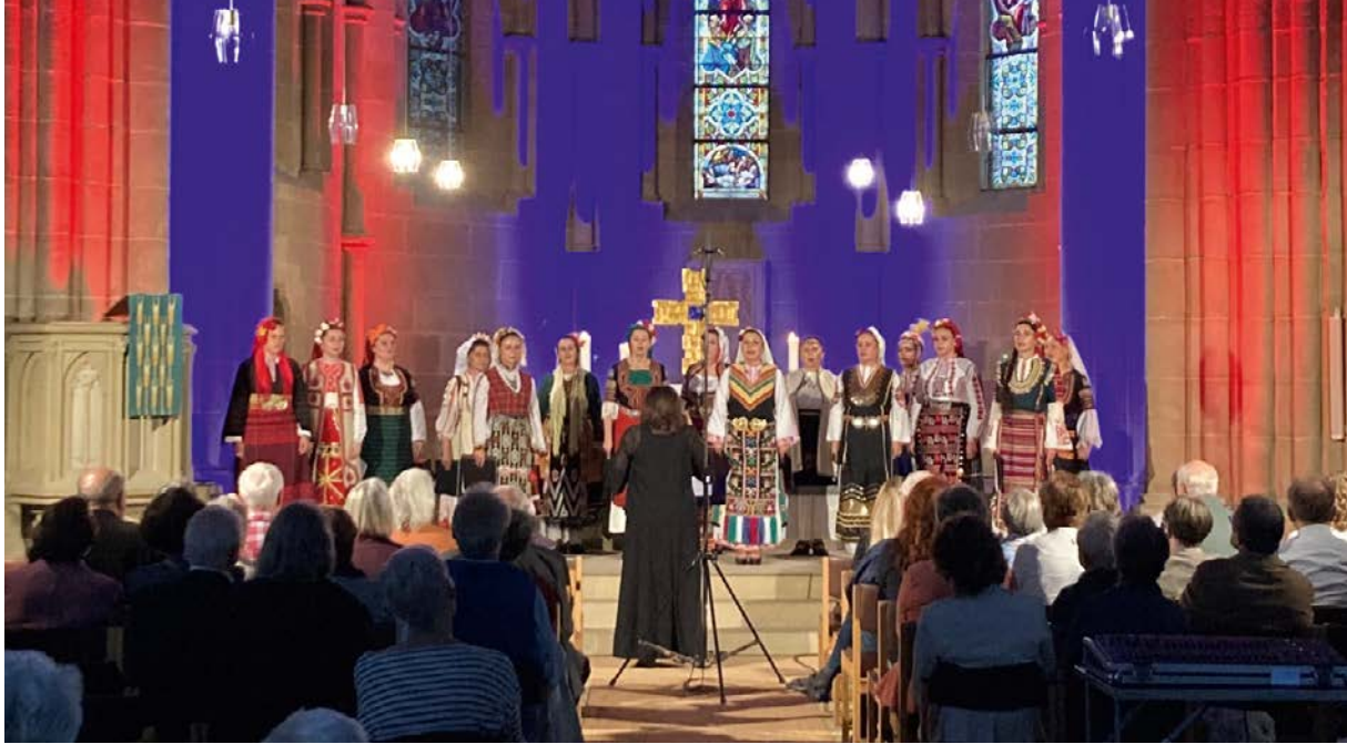
Ensemble Angelite Kultursommer 2022.

wegen, die nordische Liedformen mit Folk, Jazz und Rock verbanden: Es waren endlich zahlreiche Gäste aus den Ländern Nordeuropas zu Gast.