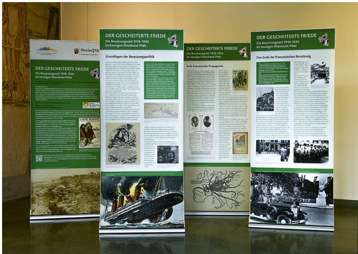
Wanderausstellung „Der gescheiterte Friede“.

(IGL) in Kooperation mit weiteren Kultureinrichtungen erstellt und im Januar 2021 im MFFKI eröffnet und ist seitdem auf Wanderschaft. Das Ausstellungsprojekt, das unter der Schirmherrschaft der Ministerpräsidentin steht und von der Stiftung Rheinland-Pfalz für Kultur gefördert wurde, greift das Thema der französischen und amerikanischen Besatzung der Jahre 1918 bis