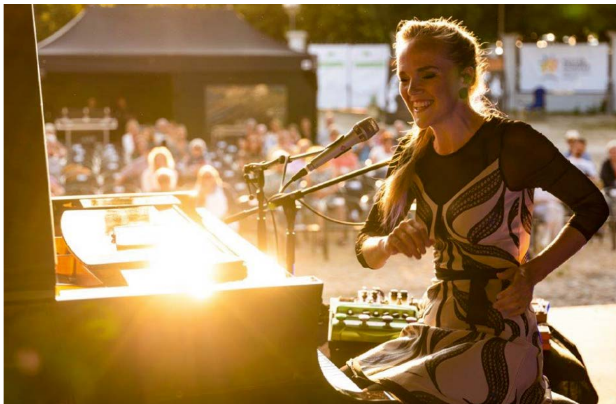
Nordic Jazz Kultursommer 2021.

Ob der finnische Akkordeonvirtuose Kimmo Pohjonen, das schwedische Chortheater Amanda, Canto Fiorito aus Vilnius (Litauen), das estnische Vokalensemble Vox Clamantis, das skandinavische Jazzensemble Rhythmen oder Ljodahatt aus Nor-